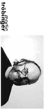
tröbinger Gewohnte hinauszudenken und gewinnt neue Sichtweisen auf eine Welt, die ihm fremd war.

Ein etwas ruhigeres Leben dürfte Dale Wassermann geführt haben. Er wurde wesentlich (sehr wesentlich) älter als Kesey und ist erst kürzlich, am 21. Dezember 2008 verstorben. Wassermann nahm sich das Buch zur Hand, strich hier und dort ein wenig Pfeffer raus, salzte andere Stellen etwas kräftiger,