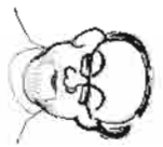
der allerbeste schmidstili

hinter der Bühne, vor den Aufführungen und danach, wenn sie wieder vorbei sind, immer noch ihre Arbeit verrichten. Als Bühnenbauer / Maskenbildner / Kassiere / Verfasser von Pressetexten und Werbestilogs / Kostümschneiderinnen / Bardamen / Sponsor-Abzockern / Produktionsleiterinnen / Regieassistenten / Gastronomieverantwortliche / Plakat- und Flyervertreter / Sitzungsprotokoll-Schreiber und als Talentescout der sich nachhens in Discos herumtreibt auf der Suche nach neuen Talenten. Nun denke ich, dass es keinem, weder Spieler noch Teammitgliedern egal ist ob das Stück ein Erfolg wird oder nicht. Die Begeistertheit ist die gleiche, ebenso wie die Freude über eine gelungene Inszenierung... Nur mit der Anerkennung und der Belohnung