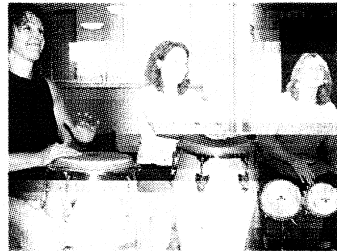
Die Gruppe "Sosamma Percussion" hat ihren Auftritt am 25.11.